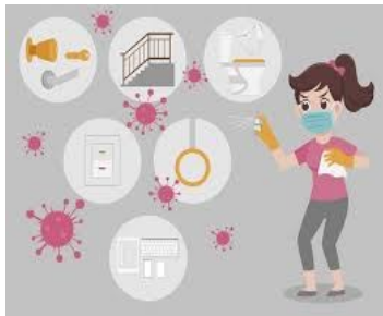
Permanencia del coronavirus activo en diferentes superficies

Diversos estudios han demostrado que el virus de la COVID-19 puede sobrevivir hasta 72 horas.